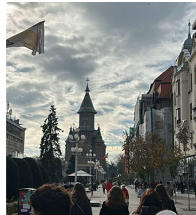
Kathedrale und 'Stolpersteine'

Die Stadt bietet natürlich auch Möglichkeiten für allerlei kulturelle Veranstaltungen, beispielsweise durch Kunstausstellungen, kleine Events oder Theaterbesuche, wie in dem deutschen Staatstheater, welches ein Teil unsere Gruppe besuchte, um uns ein Stück anzusehen. Laut meiner Recherche wurden die Kulturstätten und Unterhaltungsmöglichkeiten in diesem Jahr im Zuge der Kulturhauptstadtskampagne angekurbelt, um die Stadt für Touristen noch attraktiver zu machen, da die Stadt noch als eine verborgene Besonderheit gilt. Dies wird sich hoffentlich schon bald ändern.