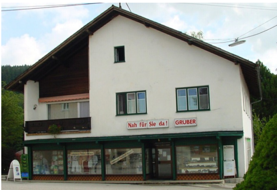
So sieht heute das „Grüner-Geschäft“ in Bruckmühl aus.